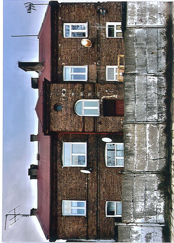
2. Elewacja tylna (południowo-wschodnia), 2020.