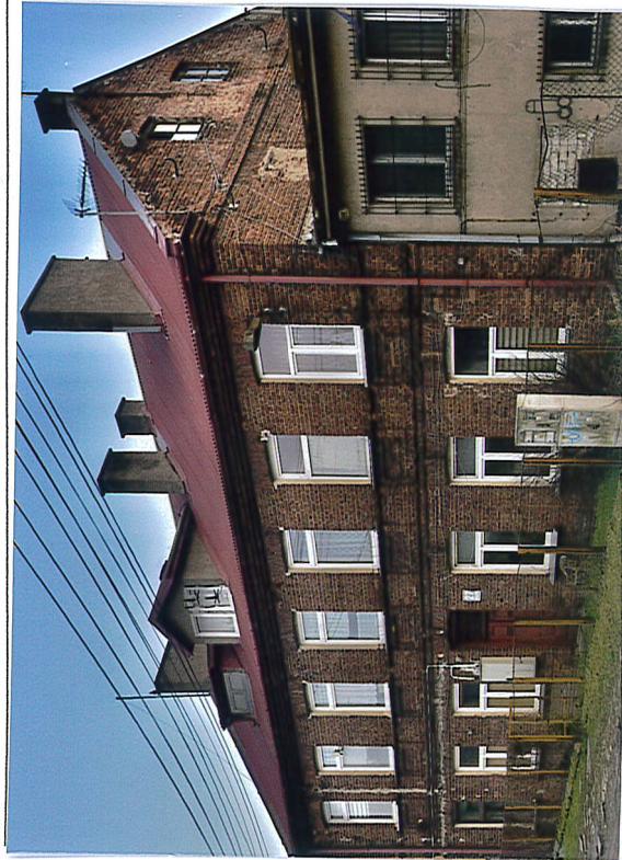
1. Elewacja frontowa od ul. Garbarskiej (północno-zachodnia), 2020.